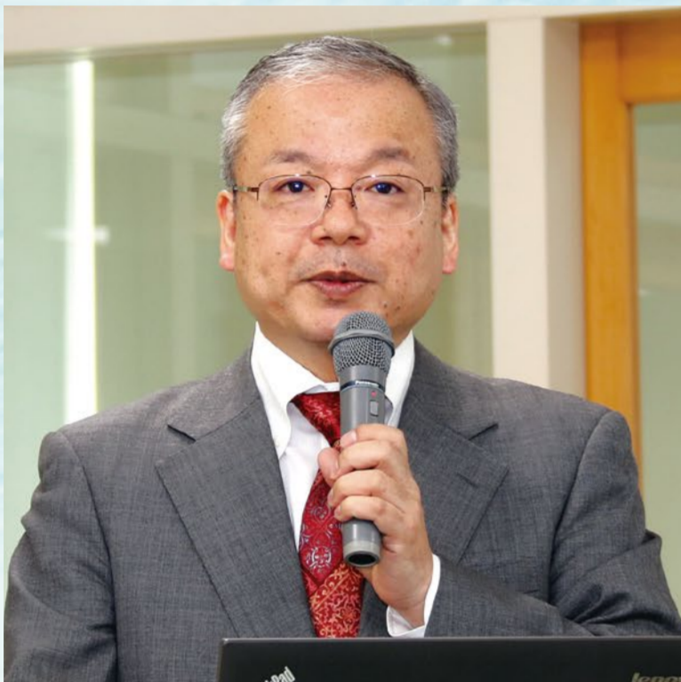
あいち小児保健医療総合センター 副センター長

食物アレルギー(小児)——特に、食べられるようにする治療を中心に 気管支喘息(成人)——特に、吸入療法を中心に